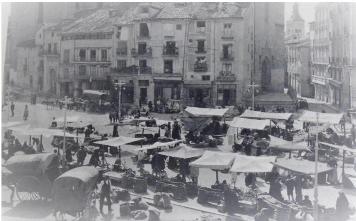
Mercado de Segovia 1932

Cuando la bombilla de su taller está apagada, es porque ha ido a vender abarcas al mercado. Charlatán, bromista, astuto, amigo del vino y poco discreto con sus opiniones, conoce a todo el mundo y todo el mundo le conoce.