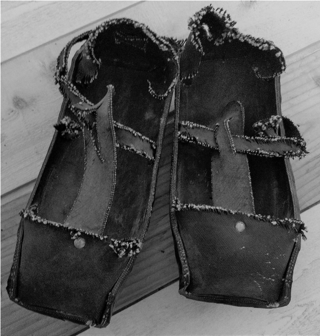
Paire d'abarcas fabriqués par Pepe en 1960.

Pepe a marché treize kilomètres, jusqu'à la caserne de la Guardia Civil .