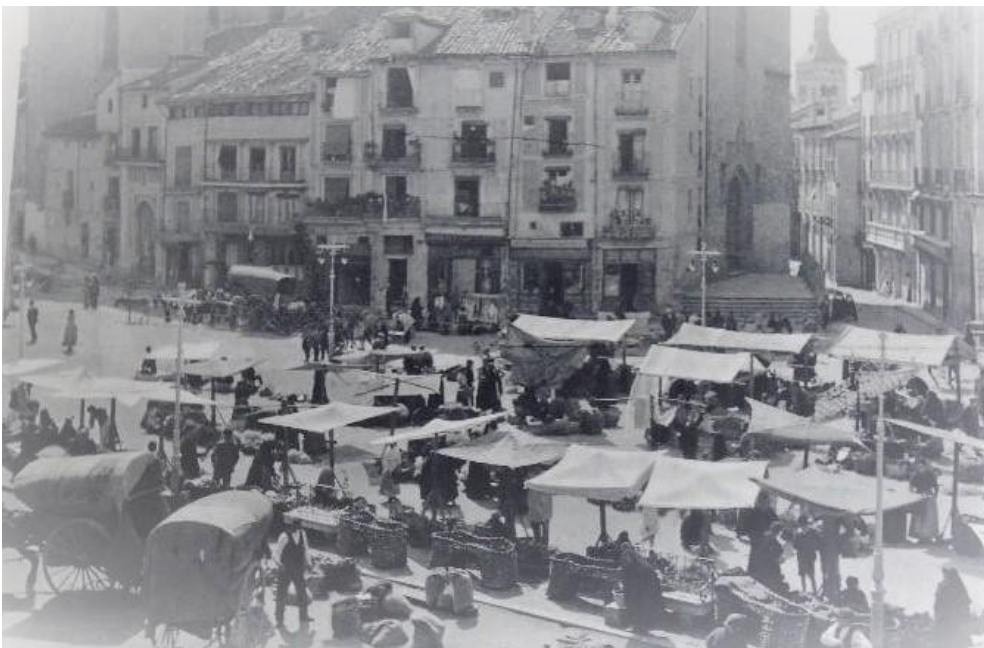
Marché de Segovia, 1935.

Quand l'ampoule nue de son atelier est éteinte, c'est qu'il est parti vendre sa marchandise au marché. Bavard, blagueur, rusé et peu discret sur ses opinions, il connaît tout le monde et tout le monde le connaît.